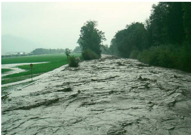
Vorentlastung der Engelberger Aa: beim Unwetter 2005...

Das IT-basierte Tool zur Einschätzung und Vorbeugung von Naturgefahren.