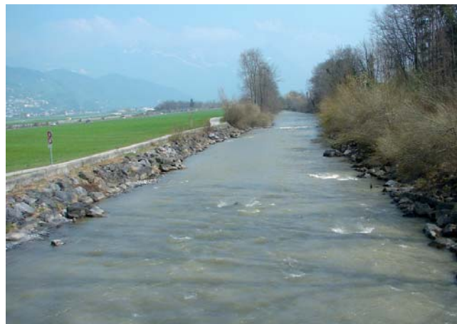
...und bei normalem Sommerwetter.

Was ist auf Dauer kostengünstiger: Ein Tunnel, der das Steinschlagrisiko auf Null reduziert – oder genügt allenfalls eine Frühwarnanlage? Welchen Beitrag können die Hauseigentümer leisten, um im Falle eines Hochwassers mögliche Schäden zu reduzieren – und wirken sich diese Massnahmen auf mögliche Schadenkosten aus? Solche Fragen gilt es beim Schutz vor Naturgefahren immer wieder zu beantworten. Wie einfach es doch wäre, wenn wir über einen Automaten verfügen würden, den wir mit Zahlen füttern könnten, um dann einen Papierausdruck mit der Anleitung zum Handeln zu erhalten.