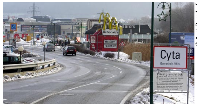
Zona commerciale nella Inntal, Austria: lo sviluppo regionale visto innanzitutto come risposta alla domanda dei consumatori.

della politica regionale nelle Alpi presentando le misure, gli strumenti e le istituzioni della politica regionale nei paesi alpini. Analizzando lo Spazio Alpino nell'insieme si cerca di raffigurare il "paesaggio" della politica regionale.