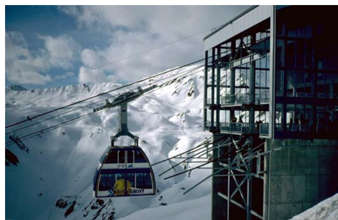
Costruzione di un nuovo skilift nelle Alpi francesi. Nell'intero Spazio Alpino si delinea una forma di sviluppo comune determinata da criteri globali.

In conclusione possiamo affermare che, benché a nostro avviso ancora presenti a livello inconscio, gli effetti tradizionali della maggior parte dei fattori culturali diminuiscono. In questo senso si apre la via verso uno sviluppo comune il cui andamento è caratterizzato piuttosto dal posizionamento che beneficia di opportunità definite da criteri globali come ad esempio lo sviluppo da paese a metropoli, anziché dalla cultura locale e regionale che tendono maggiormente all'unità. Le differenze culturali di tipo tradizionale rappresentano quindi una caratteristica limitata nel tempo destinata a scomparire. Questo è un chiaro segnale per DIAMONT: se intendiamo osservare lo sviluppo regionale come previsto dalla Convenzione delle Alpi è necessario concentrarsi sugli indicatori capaci di misurare lo sviluppo sostenibile in un mondo globalizzato anziché sugli indicatori basati sulle differenze culturali di tipo tradizionale. Gli indicatori da prendere in considerazione possono contenere delle informazioni sull'identità regionale, premesso che non si tratti di vestigia di tempi remoti o folklore bensì di uno strumento e una strategia mirati ad affrontare le sfide del futuro.