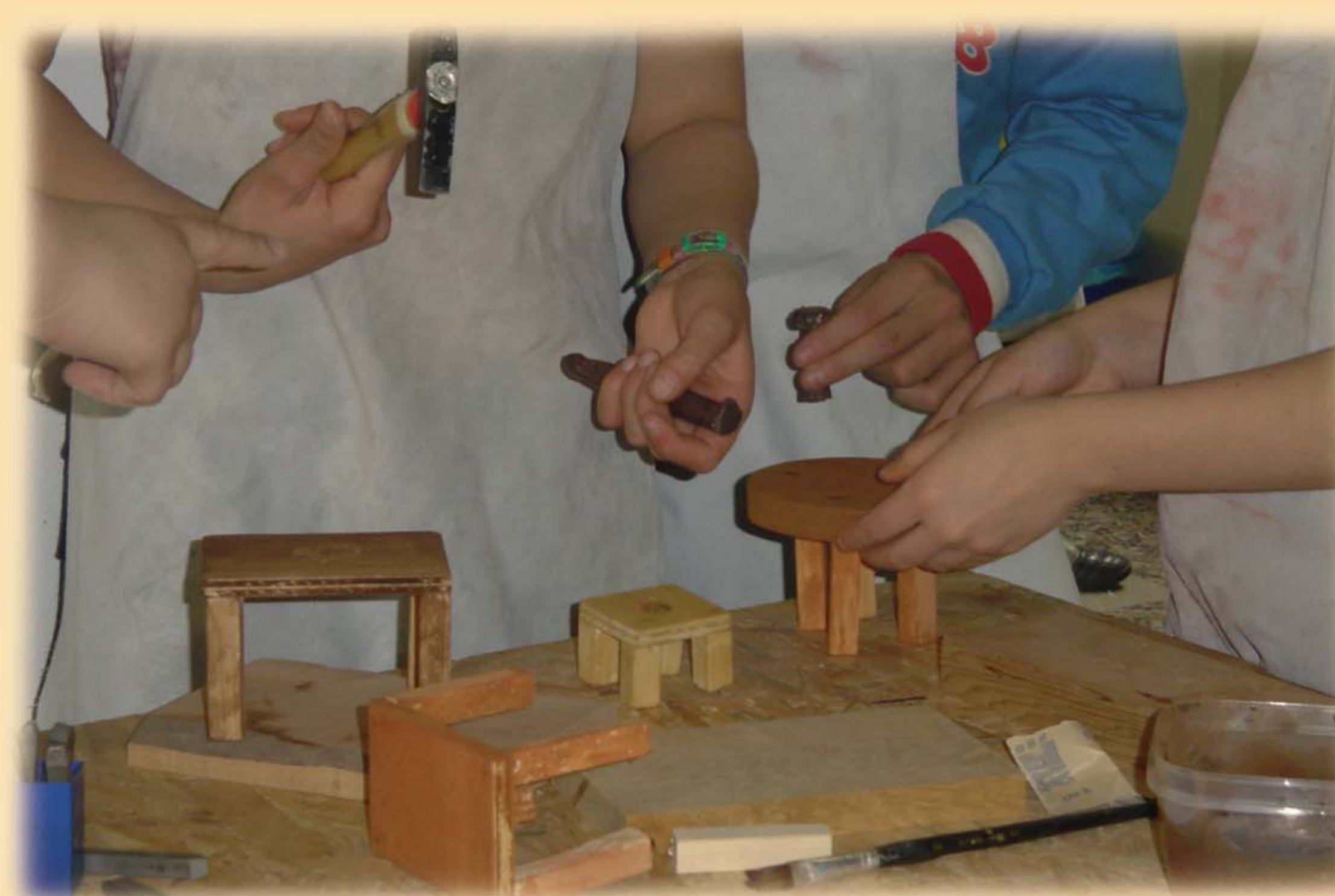
▲ Museo Etnografico di Lodrino, il laboratorio di falegnameria tradizionale