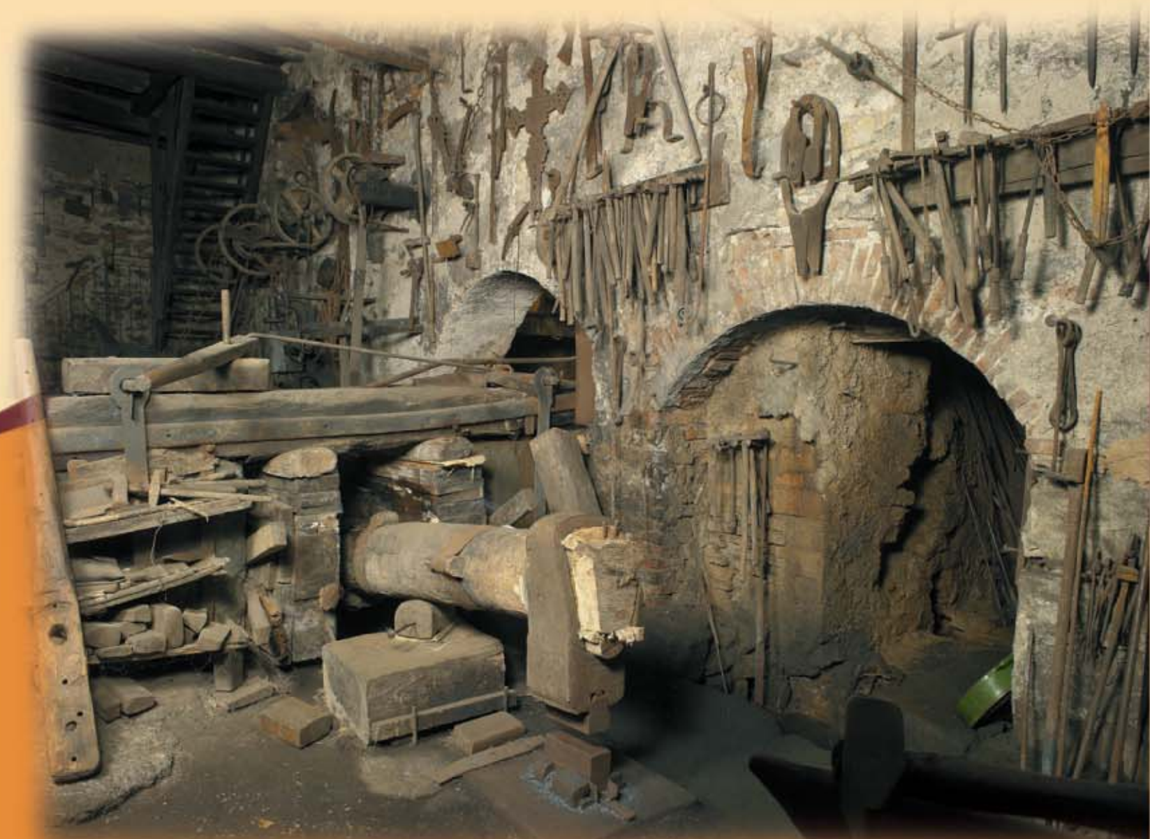
Museo Il Maglio Averoldi di Ome