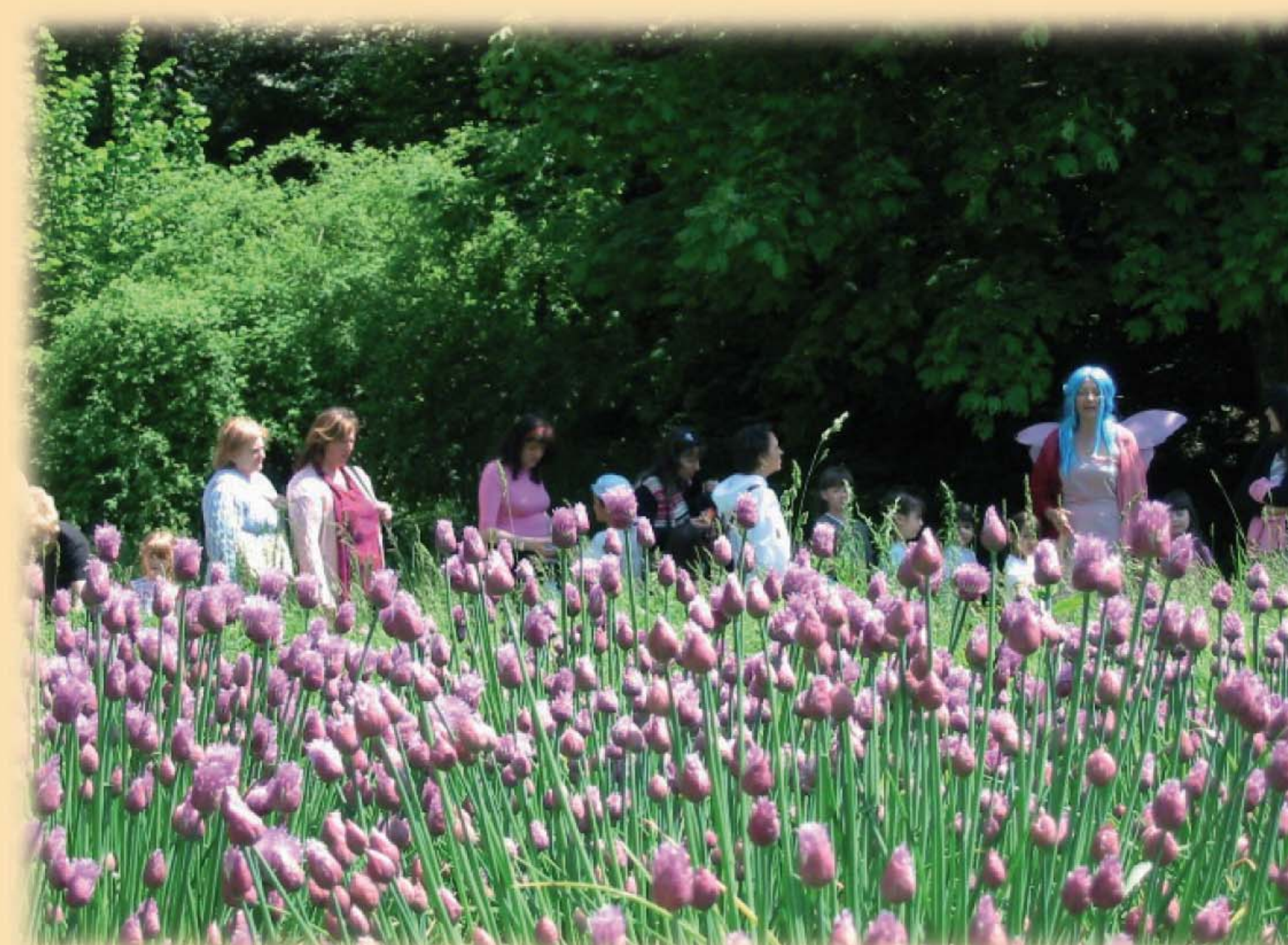
Fattoria Didattica Catena Rossa di Sarezzo, esperienza fra fiaba e bosco