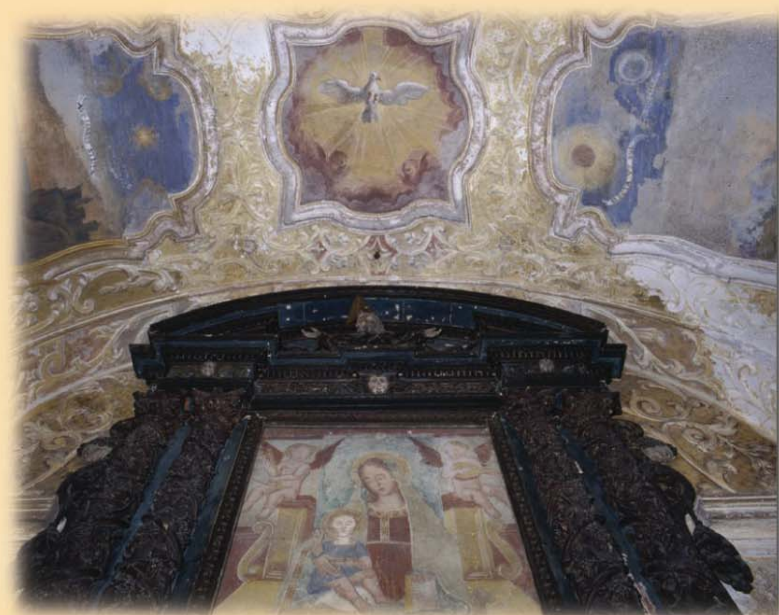
Santella della Madonna di Marcheno