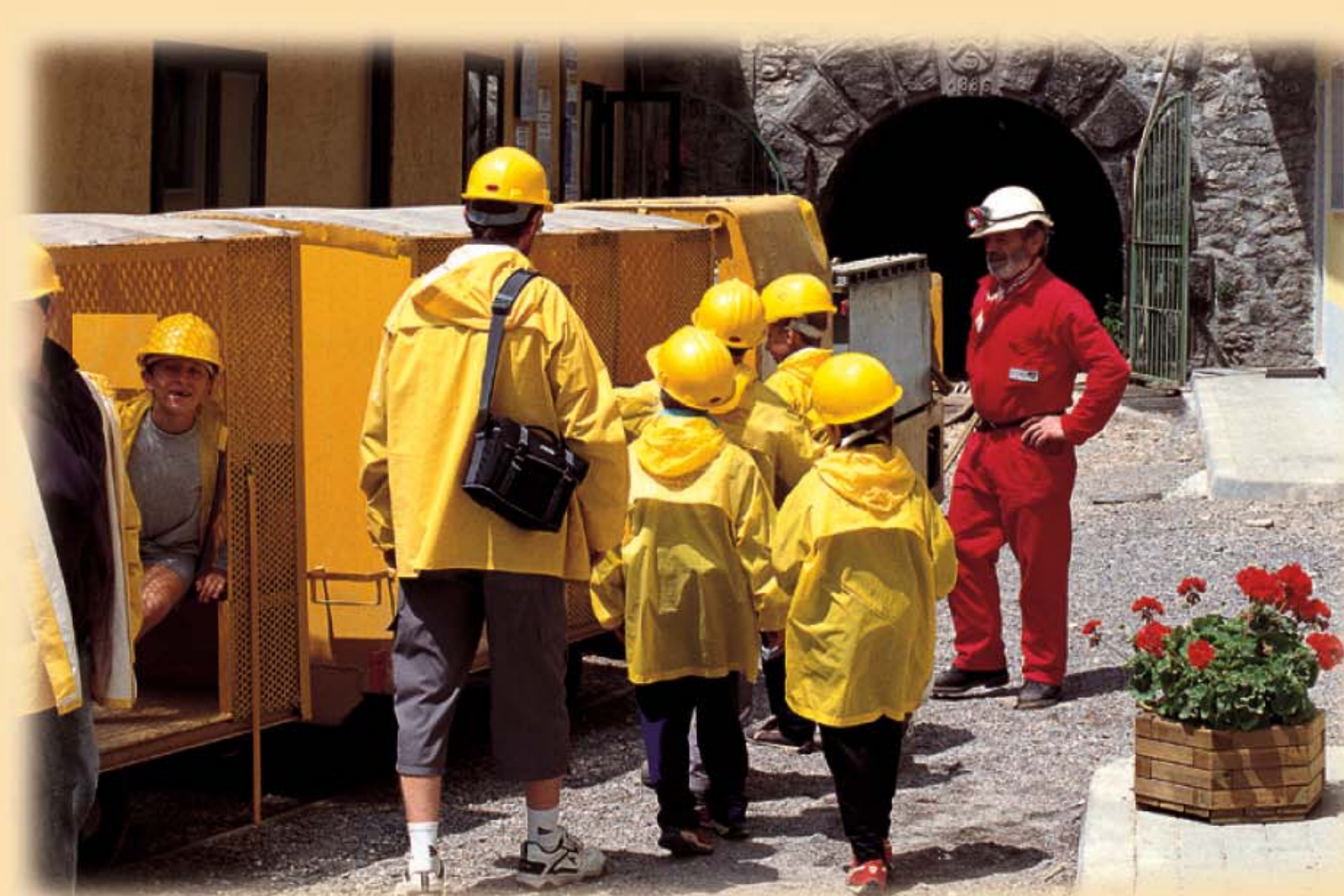
Miniera Marzoli e Museo Le Miniere di Pezzaze

Il Sistema Museale aderisce, dal 2005, ad Iron Route , azione co-finanziata dall'Unione Europea per la realizzazione di una Via Europea Alpina dei Metalli . Il progetto coinvolge importanti centri minerari e di produzione siderurgica che fanno riferimento a istituzioni italiane, slovene e austriache.