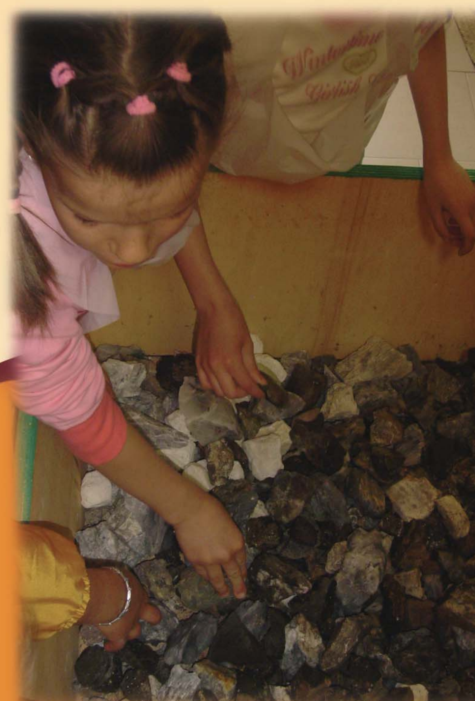
Museo Le Miniere di Pezzaze, cernita dei minerali