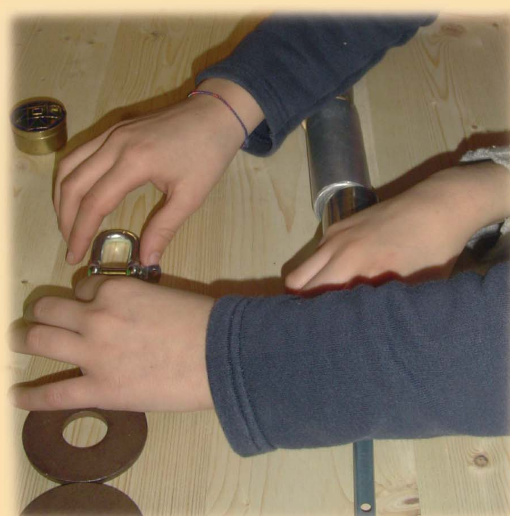
◀ Museo I Magli di Sarezzo, laboratorio Fucina dei Metalli