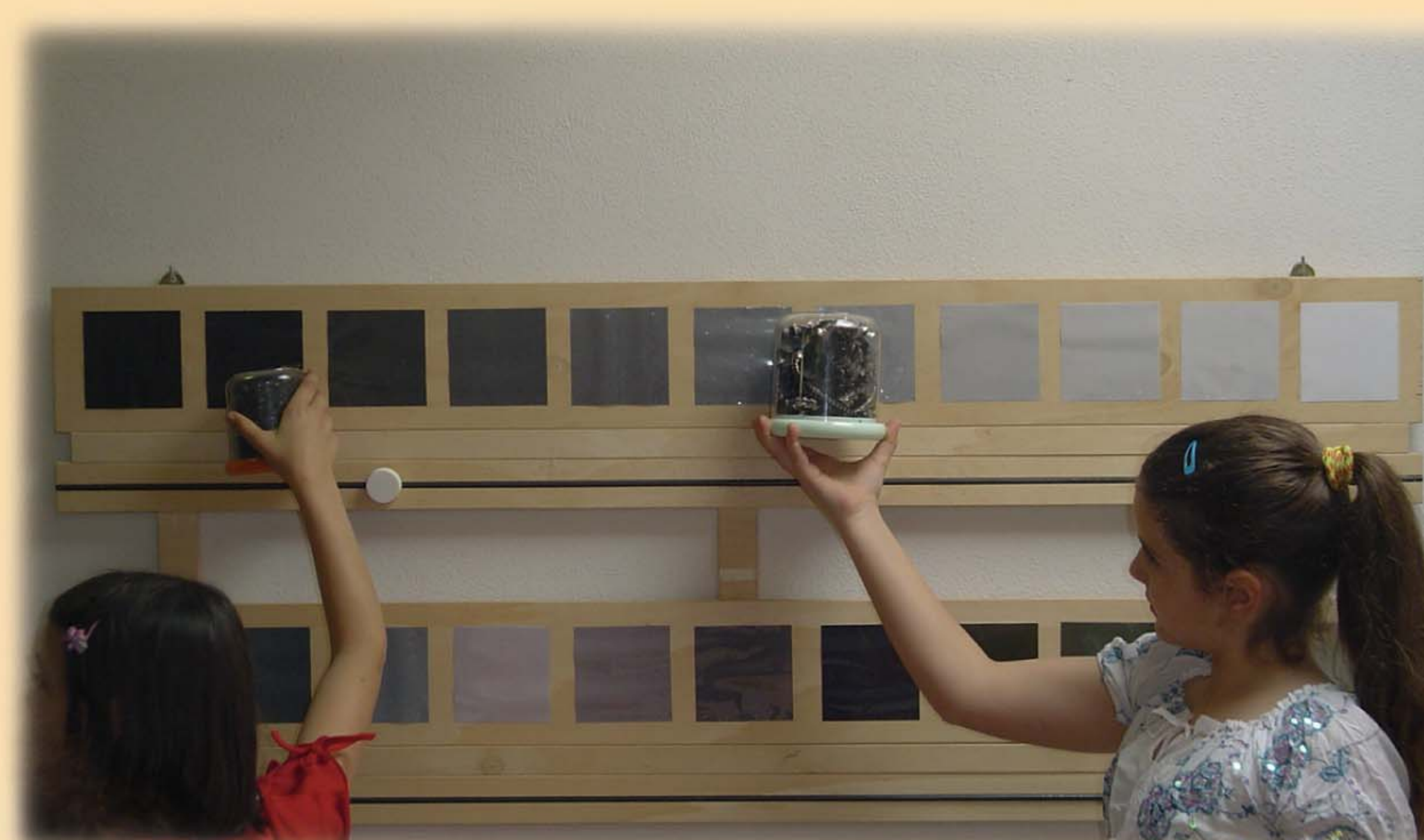
Museo I Magli di Sarezzo, animazione alla Fucina Ludoteca del Ferro: il colore