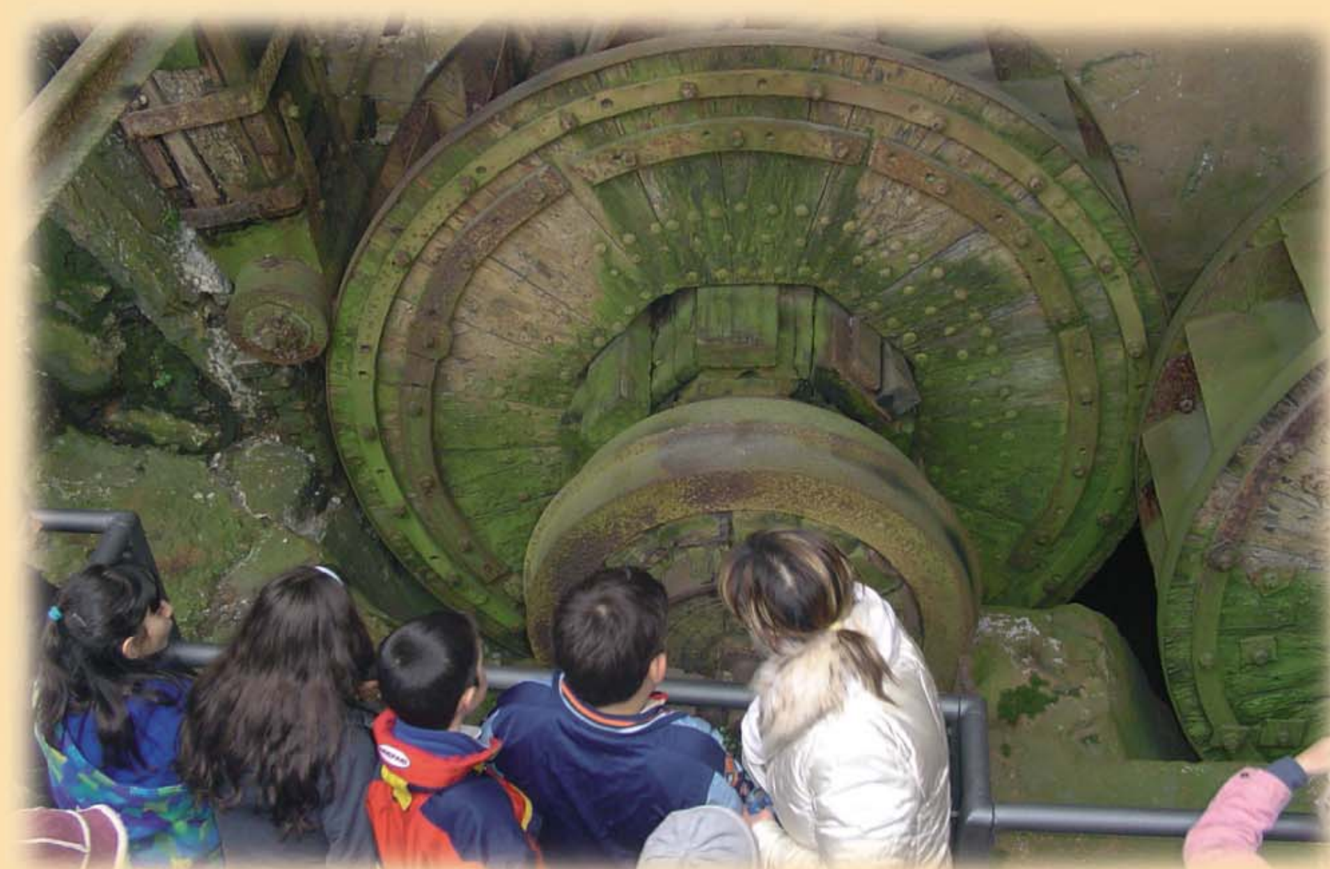
Museo I Magli di Sarezze