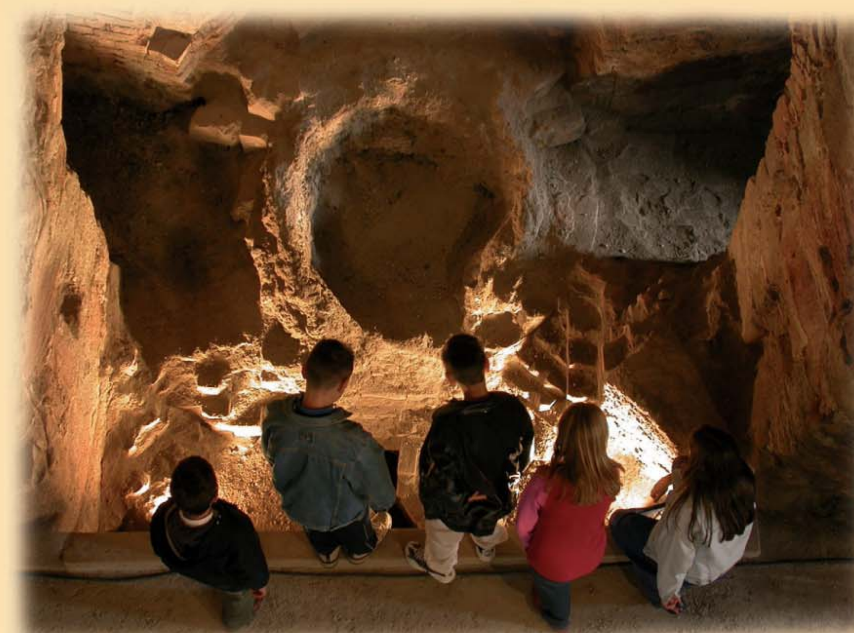
Museo Il Forno di Tavernole