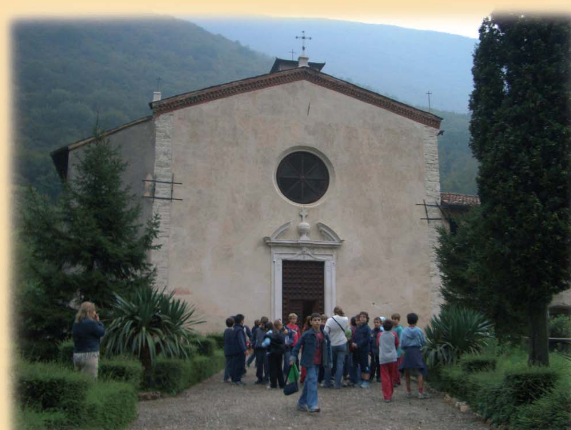
◀ Pieve di Santa Maria della Mitria a Nave, un'esperienza di ricerca archeologica

Il progetto coinvolge importanti centri minerari e di produzione siderurgica che fanno riferimento a istituzioni italiane, slovene e austriache.