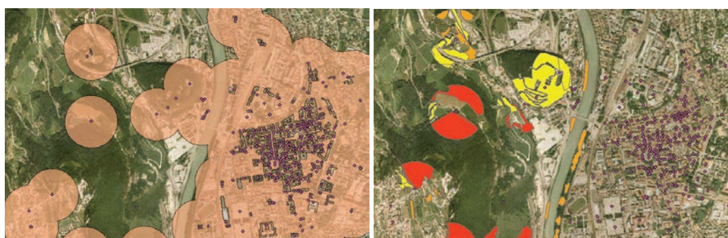
Figura 12 - Fascia perimetrale generata dai beni culturali (a sinistra) e vegetazione analizzata ricadente al suo interno (a destra), caratterizzata da valori di pericolosità bassa (in giallo), media (in arancione) e alta (in rosso)