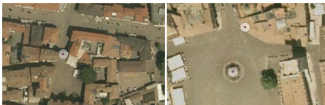
Figura 10 - Esempio di buffer circolari: Porta Urbica di S. Michele a Riva del Garda (a sinistra), fontana del Nettuno e fontana Piccola di Piazza del Duomo, Trento (a destra)

Completata la mappatura dei beni culturali si è generata la fascia perimetrale di 200 m che è stata intersecata con la vegetazione ricadente al suo interno. I poligoni ottenuti sono stati analizzati sulla base dei sei parametri previsti dalla procedura, assegnando a ciascuno un punteggio con i criteri descritti nella tabella seguente: