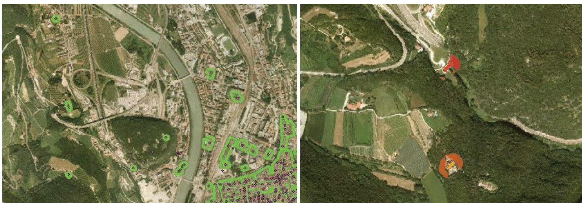
Figura 13 - Fascia di interfaccia (25 m) a sinistra, esempio di beni culturali a pericolosità alta (in rosso) e media (in arancione), a destra

La somma dei punteggi di ogni parametro ha fornito per ogni poligono un valore di pericolosità, che discretizzato in tre classi ha permesso l'attribuzione delle classi di alta, media e bassa pericolosità alla vegetazione (figura 12). A partire dai beni culturali si è generata la fascia di interfaccia di 25 m che ha assunto diversi valori di pericolosità in base ai poligoni di vegetazione analizzati che interseca. Infine, si sono selezionati i beni ricadenti nelle aree di interfaccia a bassa, media ed alta pericolosità (figura 13).